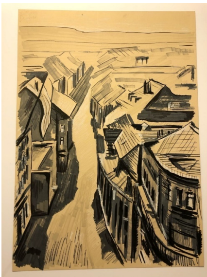
Материал маркер, тонированная бумага.