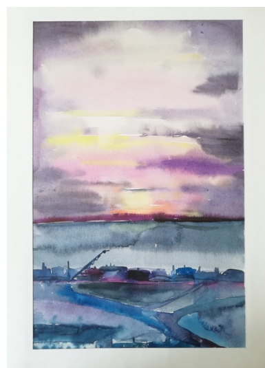
Примеры живописных этюдов