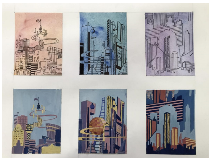
Примеры стилизации архитектуры

Определение цветового акцента. Им может стать один или два насыщенных пятна. Выполняется заполнение контуров, изображенных на втором этапе, любым цветом в соответствии с авторским замыслом. Для этого нужно определиться, какие цвета являются более характерными для изображаемого объекта. На этом этапе необходимо знание законов цветоведения о взаимно дополнительных цветах, контрасте ярких и светлых цветов по отношению к темным.